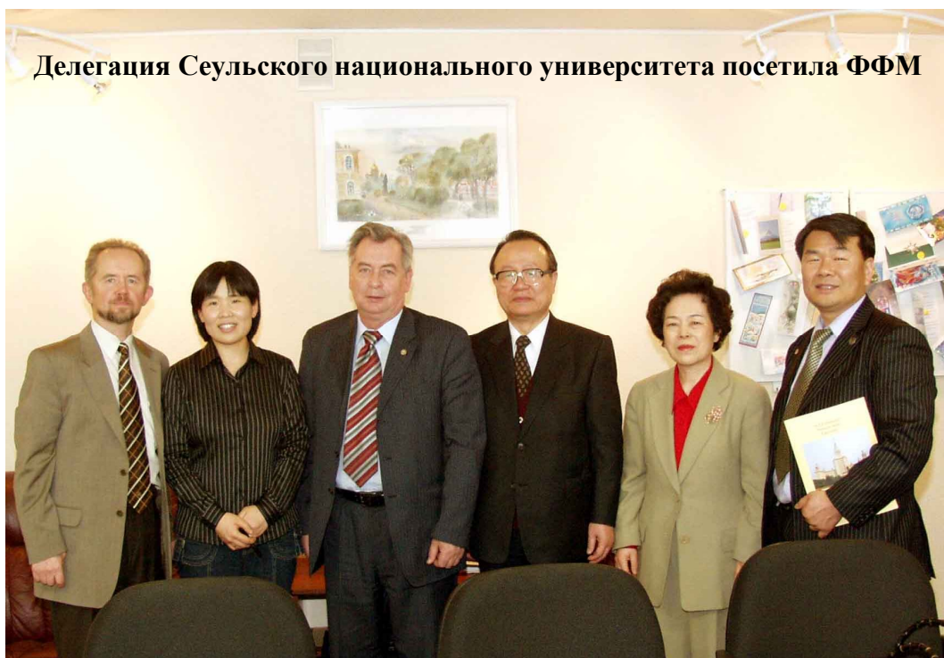
Делегация Сеульского национального университета посетила ФФМ

Студенты ФФМ участвовали в двух хирургических олимпиадах в г.Москве, где заняли высокие места в отдельных видах соревнований.