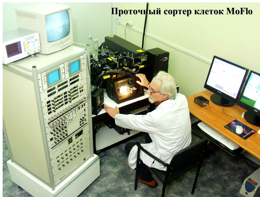
Проточный сортер клеток MoFlo

Помимо плановых НИР, факультет участвовал в выполнении 2 тем по ФЦНТП «Исследования и разработки по приоритетным направлениям развития науки и техники» (в том числе по 1 научной школе), 1 темы по аналитической ведомственной целевой программе «Развитие научного потенциала высшей школы (2006-2008 годы)» Минобрнауки РФ, 1 темы по направлению «Формирование системы инновационного образования в МГУ им. М.В.Ломоносова» в рамках Приоритетного национального проекта «Образование», 11 грантов РФФИ, 5 договорных работ.